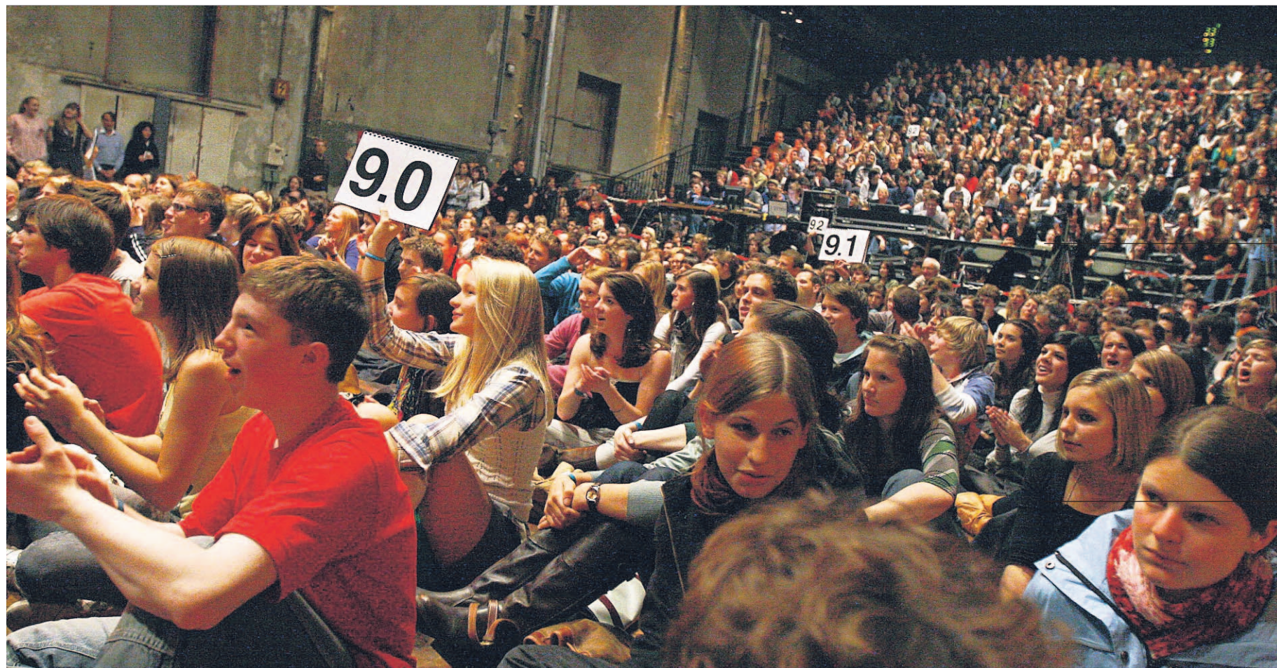
KRITISCHE JURY Bei Poetry Slams entscheidet das Publikum mit Punkten, welcher Wortakrobat eine Runde weiterkommt. RAPHAEL HÜNERFAUTH

Region Poetry Slams boomen – nun mischt eine Strengelbacherin bei den Wortakrobaten mit